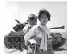
جنگ ویتنام که جهنمی‌ترین جنگ قرن بیستم نام گرفت، زمانی آغاز شد که آتش جنگ کره به تازگی خاموش شده بود. در جنگ ویتنام و جنگ کره، نیروهای آمریکا و شوروی در برابر یکدیگر صف‌آرایی کردند.