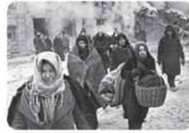
جنگ جهانی دوم به مرزها محدود نماند، به درون شهرها کشیده شد و غیرنظامیان، زنان و کودکان را نیز درگیر جنگ ساخت.

ث) جنگ سرد: پس از جنگ جهانی دوم، دو بلوک شرق و غرب هر یک، بخشی از جهان را زیر نفوذ خود قرار دادند: