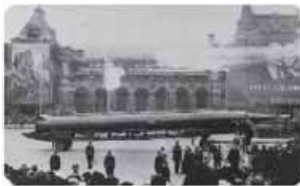
تصمیم شوروی مبنی بر استقرار موشک‌های میان‌برد در کوبا

نتیجه: جنگ‌های فوق (سرد و گرم) به اقتصاد کشورهای صنعتی یعنی اقتصاد وابسته به تسلیحات نظامی رونق بخشید.