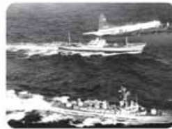
بحران موشکی کوبا که جهان را تا آستانه جنگ جهانی سوم پیش برد؛ حضور هم‌زمان ناوهای شوروی و آمریکا در آب‌های کوبا