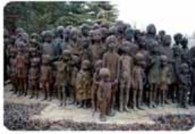
تندیس کودکان قربانی جنگ جهانی دوم در شهر پراگ، پایتخت جمهوری چک

ت) گستره جغرافیایی جنگ‌ها: هر دو جنگ جهانی با درگیری کشورهای اروپایی آغاز شدند، اما در ادامه به کشورهای اروپایی و غربی محدود نشدند، بلکه همه جهان را درگیر خود ساختند. حتی بعد از خاتمه جنگ جهانی دوم نیز صلحی پایدار، برقرار نشد.